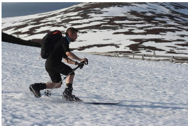
Kaihoisa muisto Pallakselta kesäkuulta 2017. Kaipaamaan Lapin uuden lumen peittäviä rinteitä

Maailma näyttää erilaiselta prätjän takaa.