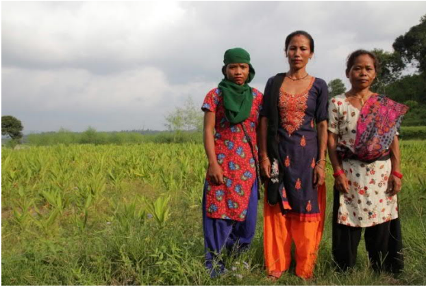
Alakastisia viljelijöitä Mardin kunnasta esittelemässä turmerik-viljelmää ja sitruspuita. Nämä lajikkeet kestävät aiempaa paremmin muuttuneita sääoloja.