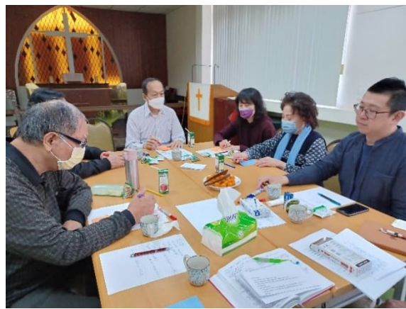
Jiu Run seurakunnan johdon ja vastuunkantajien tulevaisuustyöpaja