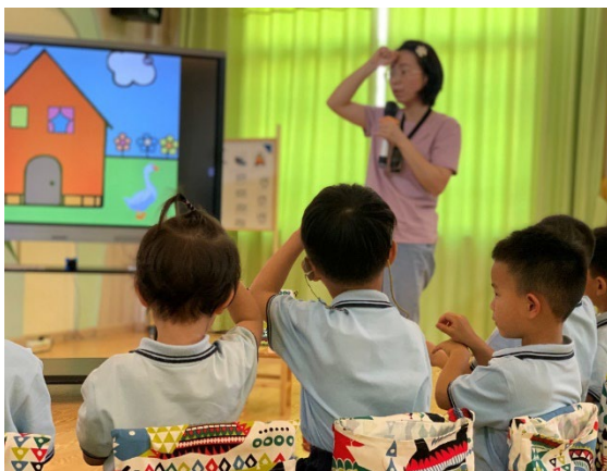
Opettaja opettaa sekä kuulevia että kuuroja lapsia.

Manner-Kiinan koronasulut jatkuivat aivan joulukuun loppumetreille saakka, kunnes ne yllättäen purettiin! Syksyn aikana sadat miljoonat kiinalaiset ovat olleet koronasulkujen ja rajoitusten kohteena, vaikka maailma ympärillä oli jo avautunut. Toki samaan aikaan useat alueet Kiinassa ovat voineet jatkaa elämäänsä melko normaalisti, sillä koronasulut eivät ole koskettaneet kaikkia alueita. Lopulta myös kansalaisten mieliala vaihtui, jonka arvellaan vaikuttaneen koronarajoitusten purkamiseen. Kiinassa harvinaiset mielenosoitukset johtivat ensin esimerkiksi Guangzhoun ja Chongqingin suurkaupunkien rajoitushöllennyksiin, siitä huolimatta, että tauti levisi. Lopulta kaikki koronasulut poistettiin. Niinpä kiinalaisen uuden vuoden aikaan Hongkongissakin nähtiin pitkästä ajasta mannerkiinalaisia turisteja. Tuntuu hienolta, että matkustaminen on jälleen mahdollista! Odotamme jälleennäkemistä innokkaasti!