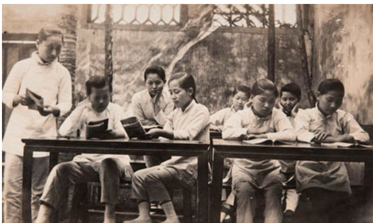
Lähetysseuran työn historiaa. Tyttöjen koulunkäynti ja tasa-arvo ovat aina olleet tärkeitä tavoitteita Lähetysseuran työssä. Kuvassa joukko tyttöjä opiskelee koulussa.

Kiinan työalueella on iloittu uusista työtovereista, avautuvista matkustusmahdollisuuksista, höllentyneistä koronarajoituksista ja hyvästä yhteistyöstä kumppaniemme kanssa. Tuleva vuosi 2023 on samalla Lähetysseuran uuden ohjelmakauden alku. Iloitsemme siitä, että Kiinan työn pitkä historia saa jatkoa uusista työskentelytavoista ja lämpimästä kohtaamisesta kumppaniemme kanssa. Tästä on hyvä jatkaa tulevaan!