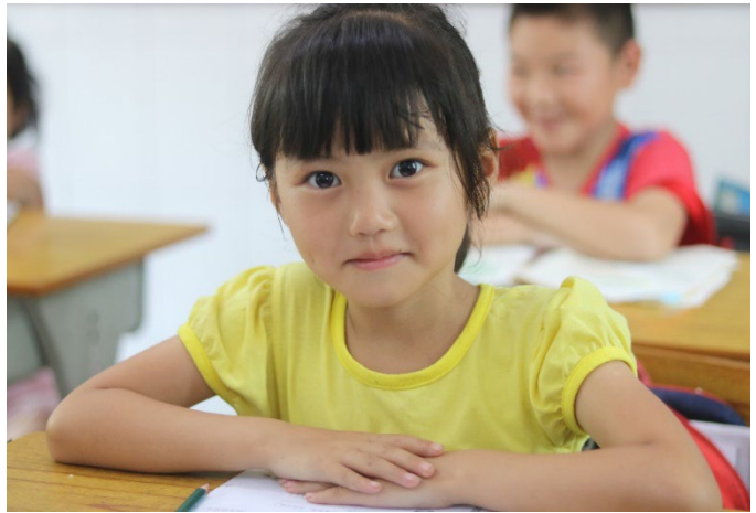
Oppilas hymyilee maaseudun kyläkoulussa. Opettajien hyvät taidot takaavat mukavan ja turvallisen koulutien.

Manner-Kiinassa tuemme myös vanhemmista erossa olevien lasten elämäntaitoja ja koulunkäyntiä. Hunanin maakunnassa vuorten ympäröimät Hengyang ja Huaihua ovat pieniä ja hitaasti kasvavia kaupunkeja. Erityisesti maaseutukylissä on tarjolla vähemmän työllistymismahdollisuuksia, joten työikäinen väestö hakeutuu suurkaupunkeihin, kuten Changshaan ja Chongqingiin. Työtä löytyy usein rakennustyömailta tai tehtaista. Ahtaisiin asuntoloihin eivät mahdu lapsi ja perhe mukaan. Niinpä lapset jäävät ikääntyvien sukulaisten hoiviin maaseudulle. Vanhukset tekevät maataloustöitä ja joutuvat samalla pitämään lapsenlapsistaan huolta. Kiinan kansalaisasian ministeriön tilastojen mukaan vuonna 2018 oli yhteensä 6,97 miljoonaa maaseudulle taakse jätettyä lasta Kiinassa. Taakse jätetyt lapset käsitte viittaa alle 16-vuotiaisiin alaikäisiin lapsiin, joiden molemmat vanhemmat ovat siirtolaisia tai yksi vanhempi on siirtolainen ja toisella ei ole huoltajuutta.