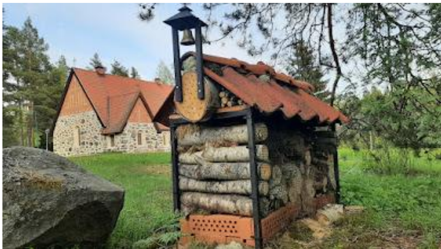
Hyönteishotelli Aitolahden vanhan kirkon pihamaalla

Luomisen juhlaa täynnä jälleen on kaikki maa.