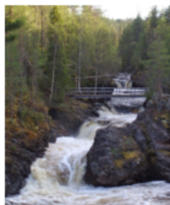
Tämä kuva, tekijä Tuntematon tekijä, käyttöoikeus: CC BY-NC-