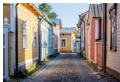
Tämä kuva, tekijä Tuntematon tekijä, käyttöoikeus: CC BY-NC-ND