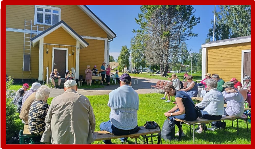
Kuva 2 Kuusamon seurakuntavierailulla oli monenlaista ohjelmaa ja tärkeitä kohtaamisia.