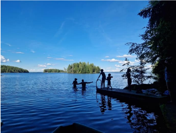
Kuva 1 Suomen serkkujen kanssa puuhailu oli parasta lapsille!

Olemme olleet nyt jo muutaman viikon takaisin täällä työalueella ja kotona Zimbabwessa kahden Suomessa vietetyn kuukauden jälkeen. Kahteen kuukauteen mahtuikin monenlaista! Sain vieraila useassa nimikkoseurakunnassa ja se oli valtavan mukavaa! Otimme vierailut perheenä kotimaanmatkailun kannalta, sillä yhdistimme niihin myös lapsille sopivaa ohjelmaa. Mikkelin tuomiokirkkoseurakunnassa, Kuusamon seurakunnassa, Herättäjä-juhilla Vaasassa ja Tampereella Messukylän sekä Harjun seurakunnissa sain tavata teitä, tukijoitani, tutustua uusiin ihmisiin,