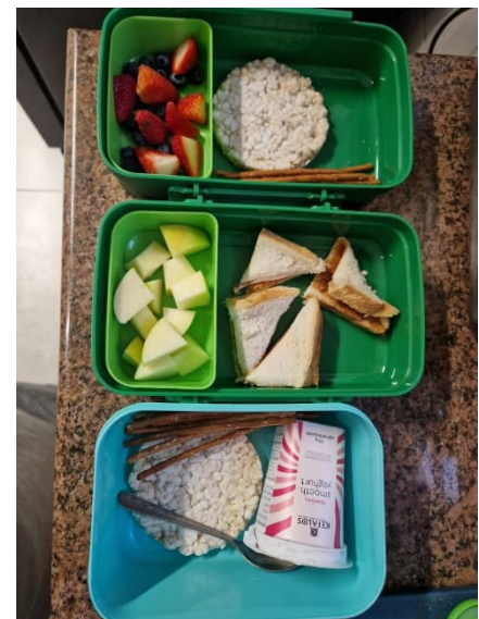
Kuva 3 Arjen rutiineihin kuuluu myös eväsrasioiden pakkaaminen aamulla

Zimbabween saavuttuamme ja pitkään pois oltuamme kotona odotti tietysti monenlaista huollettavaa ja hoidettavaa asiaa. Käytännön asioiden järjestämiseen menee aikaa ja rahaa. Pikkuhiljaa onneksi elämä on palautunut normaaliksi ja arjen rutiinit alkavat sujua. Lapset ovat aloittaneet uuden lukuvuoden koulussa. Vanhempi lapsi aloitti kakkosluokan ja pienempi siirtyi veljensä kanssa samaan kouluun, leikkikoulun puolelle suomalaista ”viskaria” vastaavalle tasolle. Molempien mielestä on ollut ihanaa olla taas koulussa, tavata vanhoja kavereita ja saada uusia. Olemme kiitollisia hyvästä koulusta, joka ottaa lapset kokonaisvaltaisesti huomioon. Koulun kautta järjestyvät myös harrastukset, jotka jatkuvat heti koulupäivän loputtua. Harrastuksia saa kokeilla monenlaisia ja kokeiluvuorossa ovat nyt uinti, tennis, karate ja jalkapallo.