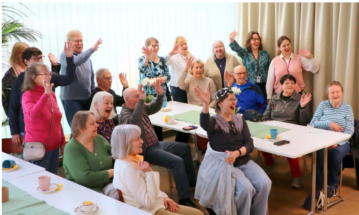
Kevään viimeisillä vertaiskahveilla kannustettiin kaikkia osallistumaan rollaattorimarssille huudahduksella: ”Pidä huolta!”.